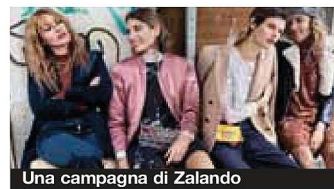
Una campagna di Zalando

Intanto, i vertici della società hanno confermato le stime per l'intero anno, che vedono una crescita del fatturato tra il 20 e il 25% e un reddito operativo adjusted tra i 220 e i 270 milioni di euro. In seguito all'annuncio del bilancio trimestrale il titolo, quotato in Borsa dal 2014, è salito a Francoforte a quota +3,3% a 45,07 euro per azione, in crescita del 9,6% negli ultimi dodici mesi. (riproduzione riservata)